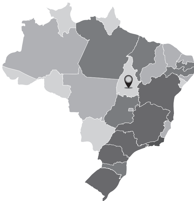
Figura I. Mapa político-administrativo del estado de Tocantins.