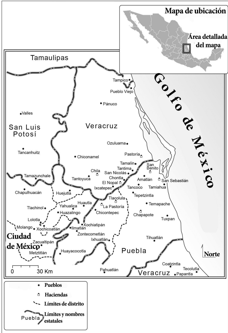
MAPA 6.1. La Guerra de Castas de 1845 a 1849