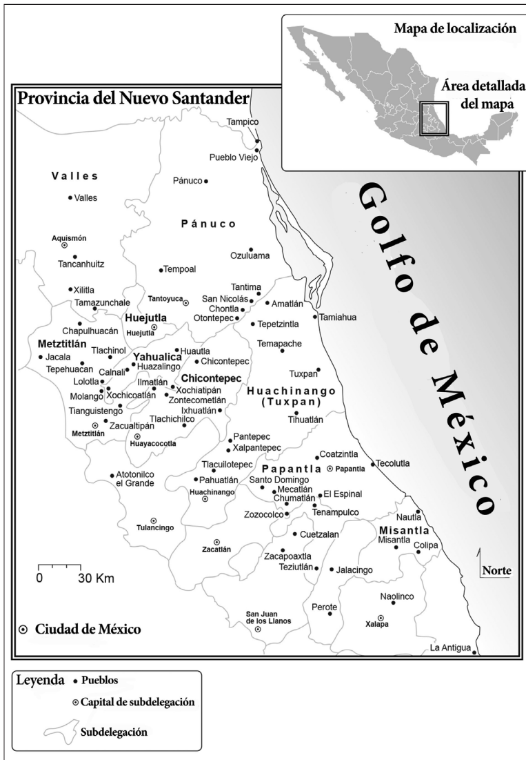
Mapa 1.1. Pueblos y subdelegaciones coloniales, c. 1800 (adaptado de A Guide to the Historical Geography of New Spain , de Peter Gerhard; edición revisada (c) 1993, University of Oklahoma Press, Norman)