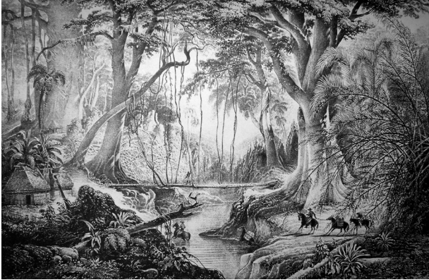
Imagen 1.1. Monte Virgen , una litografía de Carl Nebel, el talentoso visitante e ilustrador alemán, presenta una visión romántica de las selvas de tierra caliente de Veracruz. Nebel incluyó casas e individuos para destacar las abrumadoras dimensiones de los árboles. Describió la vegetación selvática como gigantesca y peligrosa aunque también estaba consciente de la gran utilidad que los nativos del país sacaban de sus productos. Véase Viaje pintoresco y arqueológico sobre la parte más interesante de la República Mexicana, en los años transcurridos desde 1829 hasta 1834, 1840 .

Si bien la Huasteca fue una región prehispánica asociada a la cultura te-neka (o huasteca), siempre albergó a hablantes de náhuatl, tepehua, otomí y totonaca. Para el siglo XVIII fue también hogar de una significativa población no indígena, consistente en criollos, mestizos y fromestizos. 46